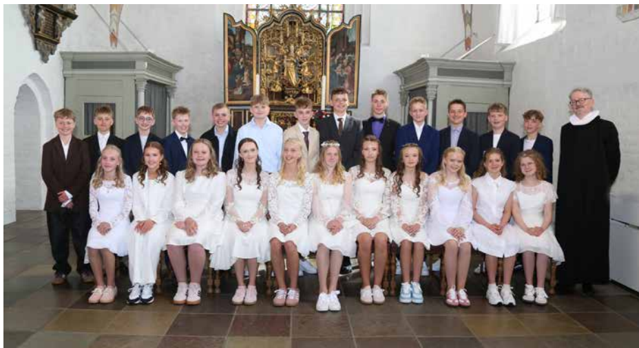
Konfirmandfotos: Click, Grønnegade 17, Sæby

Understed Vognmandsforretning Tlf. 21 21 44 70