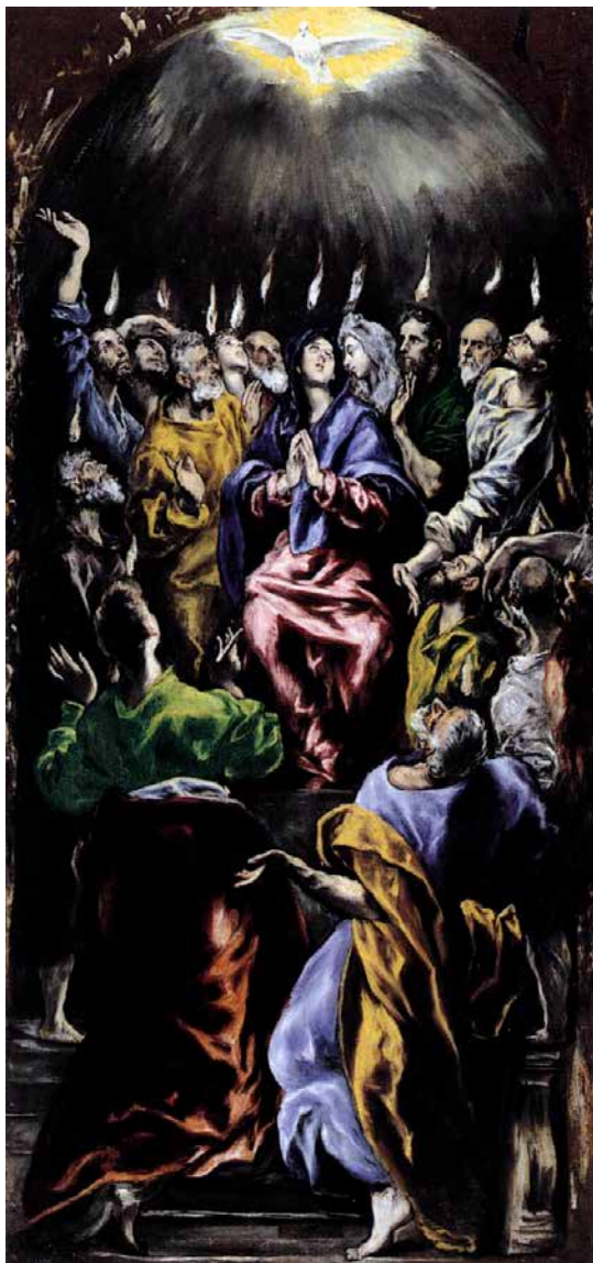
El Greco – Psinsen, ca. 1600. Fra WikiCommons. Public domain.

På det mest frodige tidspunkt på året, der, hvor foråret slutter og sommeren begynder, der kan vi også fejre pinse.